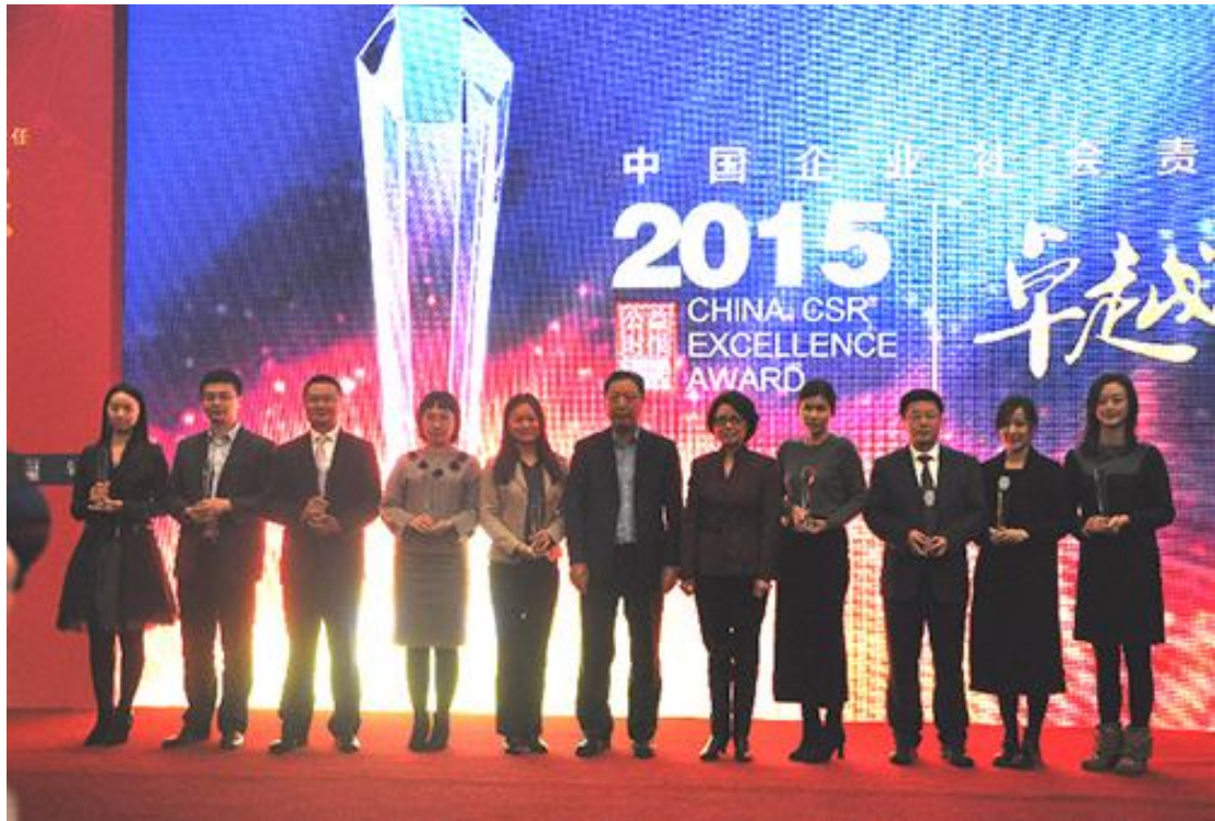
2015年12月，“中国企业社会责任2015（第五届）卓越奖”举办，现场发布《年度企业社会责任观察报告》。