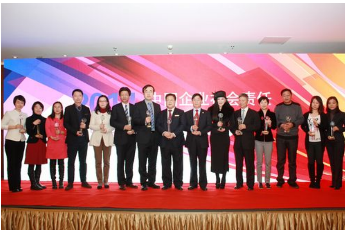
2011年12月，举办首届“中国企业社会责任优秀案例”发布活动，收集优秀案例173个。